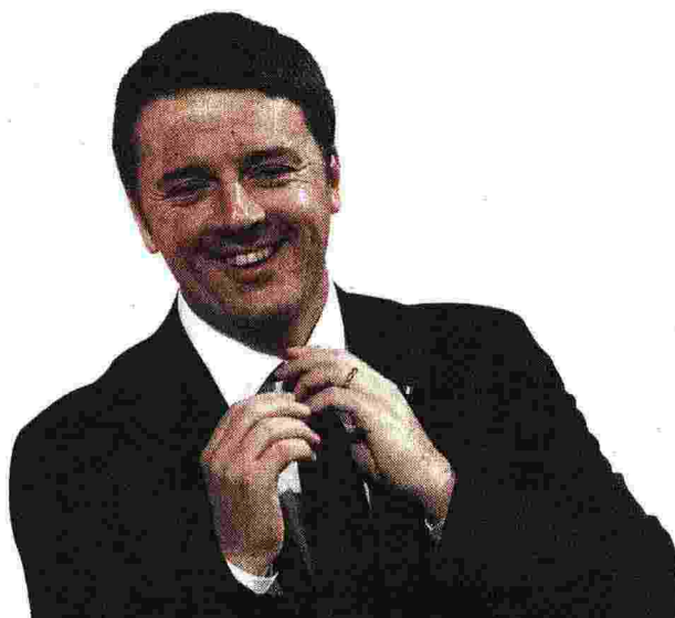
Riforme Il presidente del Consiglio Matteo Renzi

Le grandi banche d'affari fanno previsioni contrastanti